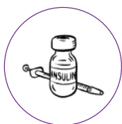
Cukrovka a obezita